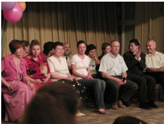
Вот она, наша славная когорта!