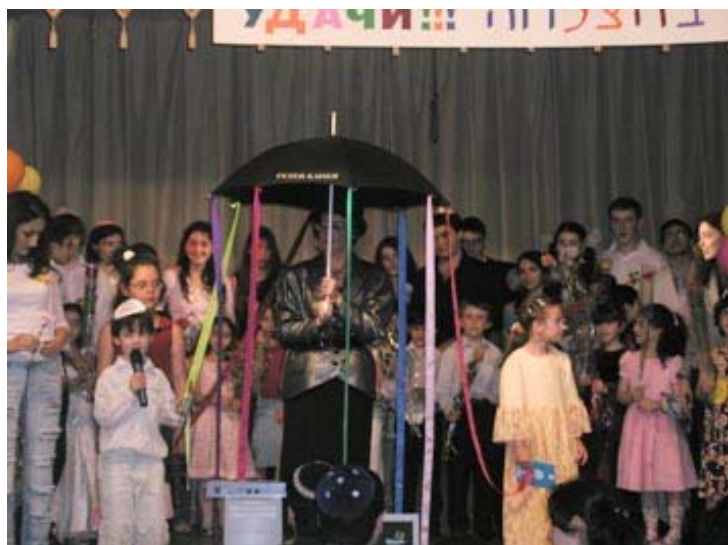
Звёзды предсказали нашим ученикам успех и удачу во всем.