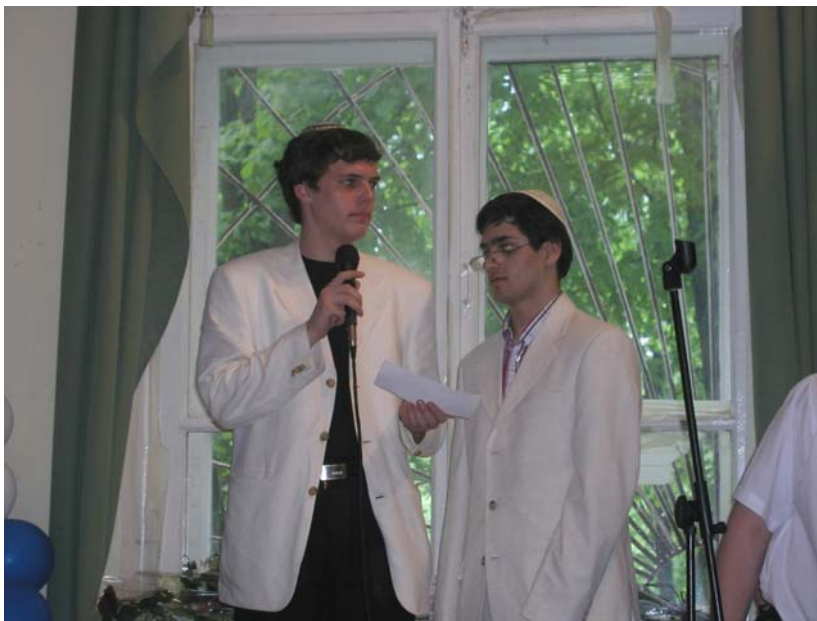
Иногда учителем быть очень приятно!