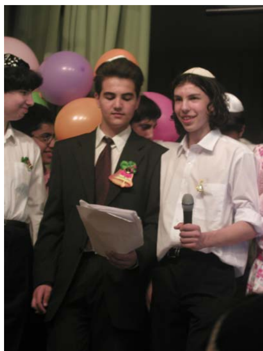
Абсолютные умники, всегда спортсмены, красота в мужчине не главное.