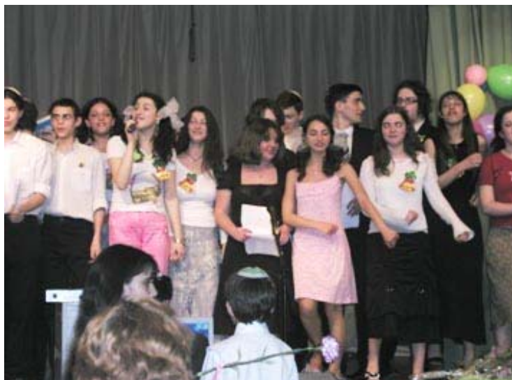
Школьная сцена - место последнего боя.