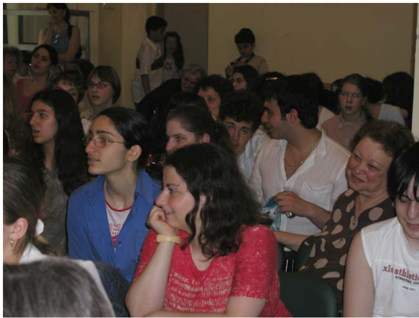
А вот и первые фанаты!