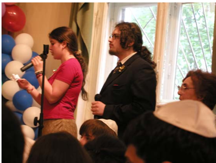
Может быть, это наша будущая смена...