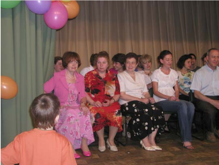
Вызов брошен, на сцене учителя в роли учеников.