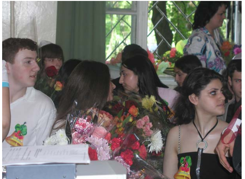
Красавцы и красавицы из 11ого класса в момент посадки.