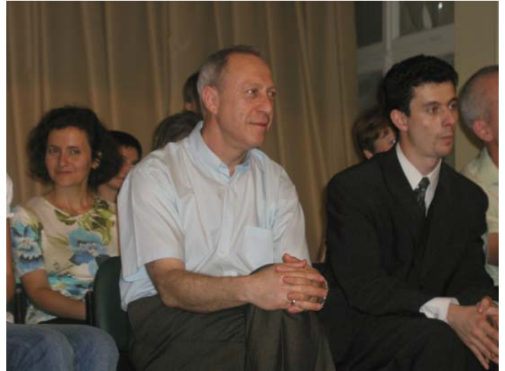
Первый удар приняли на себя мужчины-педагоги.