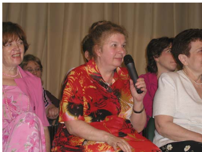
Не стареют душой ветераны!