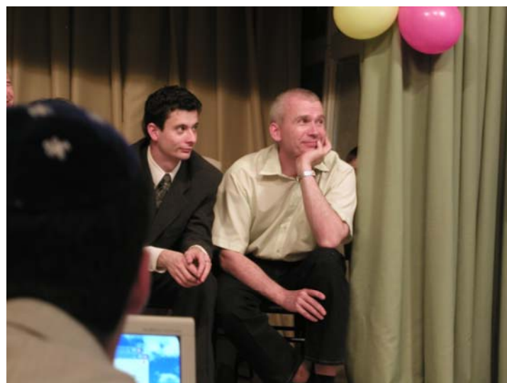
Даа, что мы от неё дождемся в будущем?