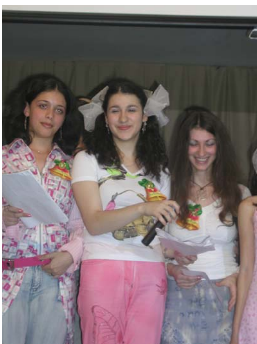
Абсолютные умницы, почти отличницы, иногда спортсменки, несомненно красавицы.