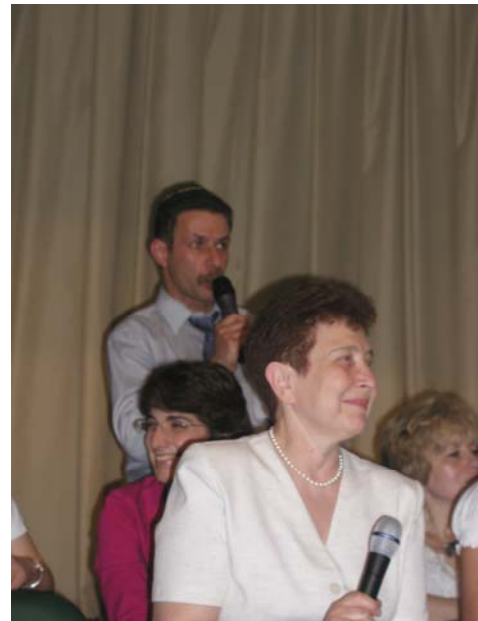
История и математика вместе могут дать ответ на всё, что угодно!