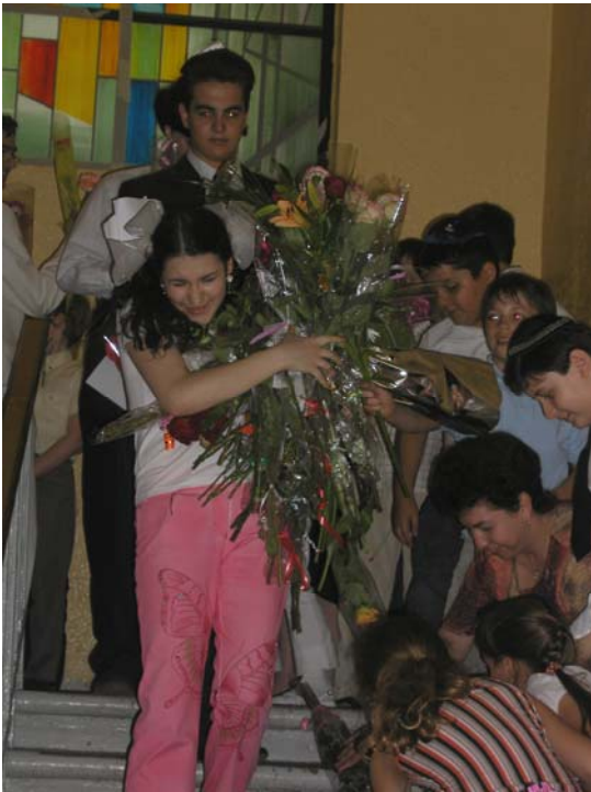
Вот она, всенародная любовь!