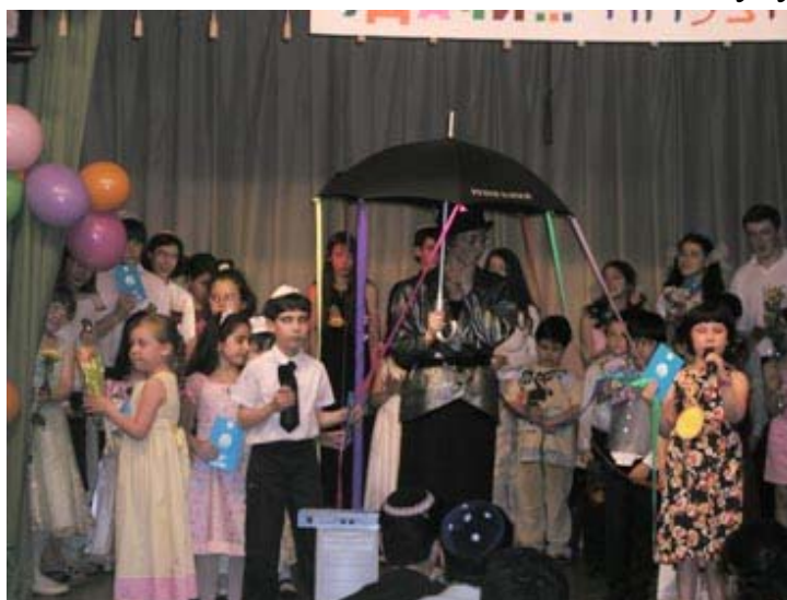
А вот про будущее выпускников как раз знает наш первый класс.