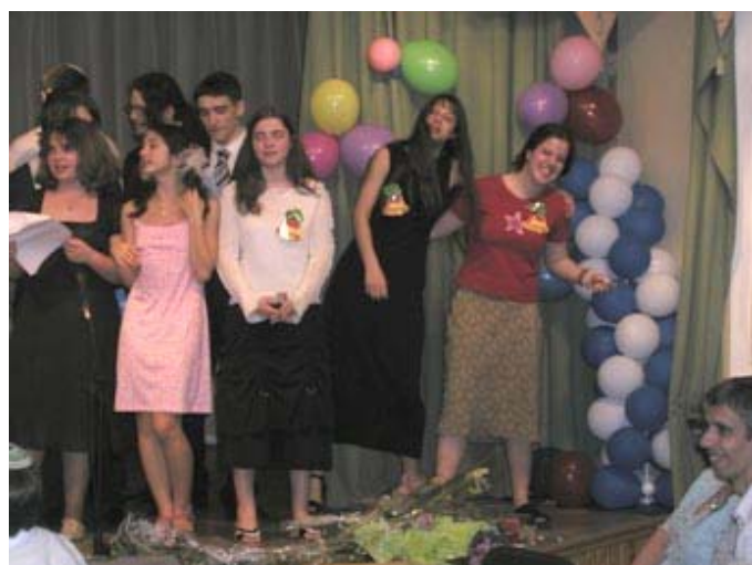
Посмотрите на них- они обречены на успех - молодые, красивые, поющие.